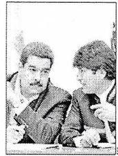
ESTA ES la primera visita de Maduro como Presidente a Bolivia.

Las posiciones son encontradas y hay voces en México que advierten que esta reforma podría ser un factor de grandes conflictos. "Peña Nieto va a encontrar la firme oposición del sindicato petrolero, que es muy poderoso y además corrupto", dice el analista Lorenzo Meyer.