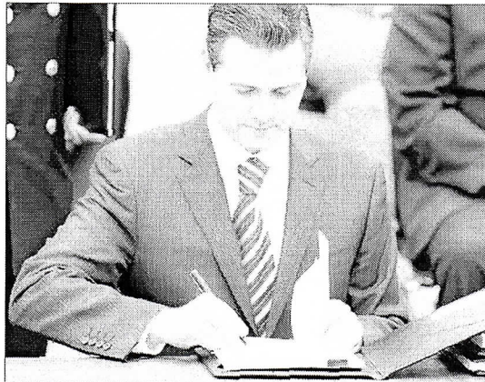
PEÑA NIETO FIRMA, a comienzos de este mes, el documento que reformará el sector financiero de su país.

Las reformas de Peña Nieto dependen del apoyo de los dos principales partidos de oposición, Partido de Acción Nacional (PAN, derecha) y Partido de