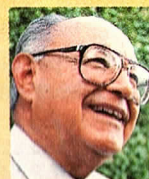
Carlos Quintero Arce (arzobispo de Hermosillo)