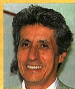
Adolfo Aguilar Zinser (polítólogo)