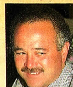
Ernesto Ruffo Appel (ex gobernador de BC)