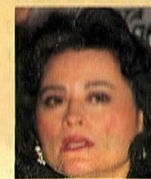
Cecilia Soto (política)