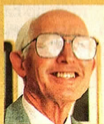
Luis H. Álvarez (senador)