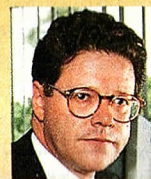
Sergio Sarmiento (periodista)